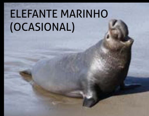
ELEFANTE MARINHO (OCASIONAL)