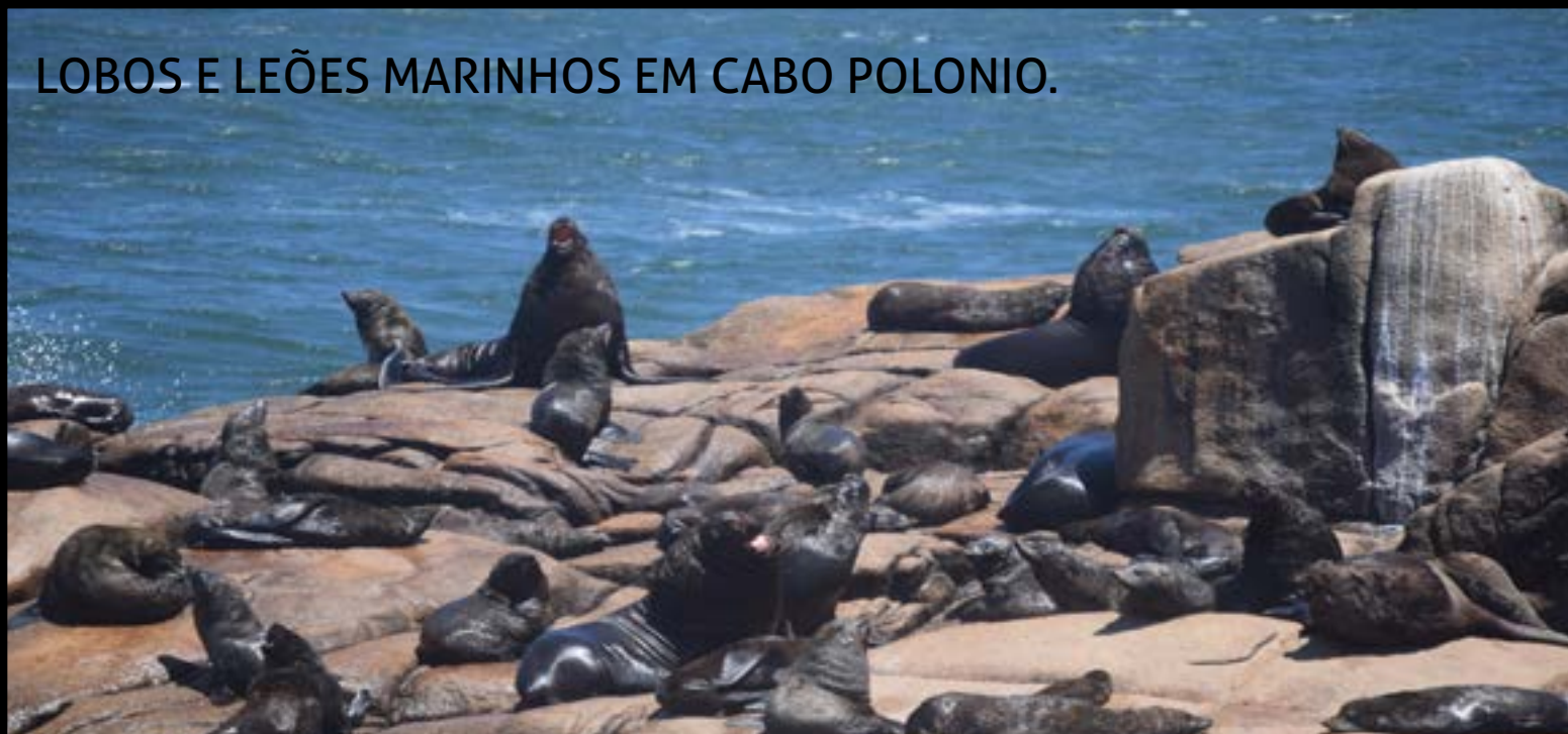
LOBOS E LEÕES MARINHOS EM CABO POLONIO.