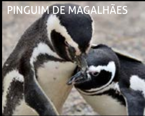
PINGUIM DE MAGALHÃES