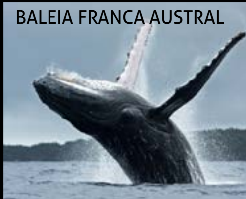
BALEIA FRANCA AUSTRAL